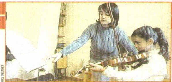
Una niña prodigio sigue las instrucciones de su profesora de violín.

Los superdotados tienen hasta tres edades diferentes, lo que les lleva a tener un proceso de maduración asíncrono. Un niño de cuatro años puede tener una edad mental de siete y una edad emocional de dos, por eso es importante tratarlos.